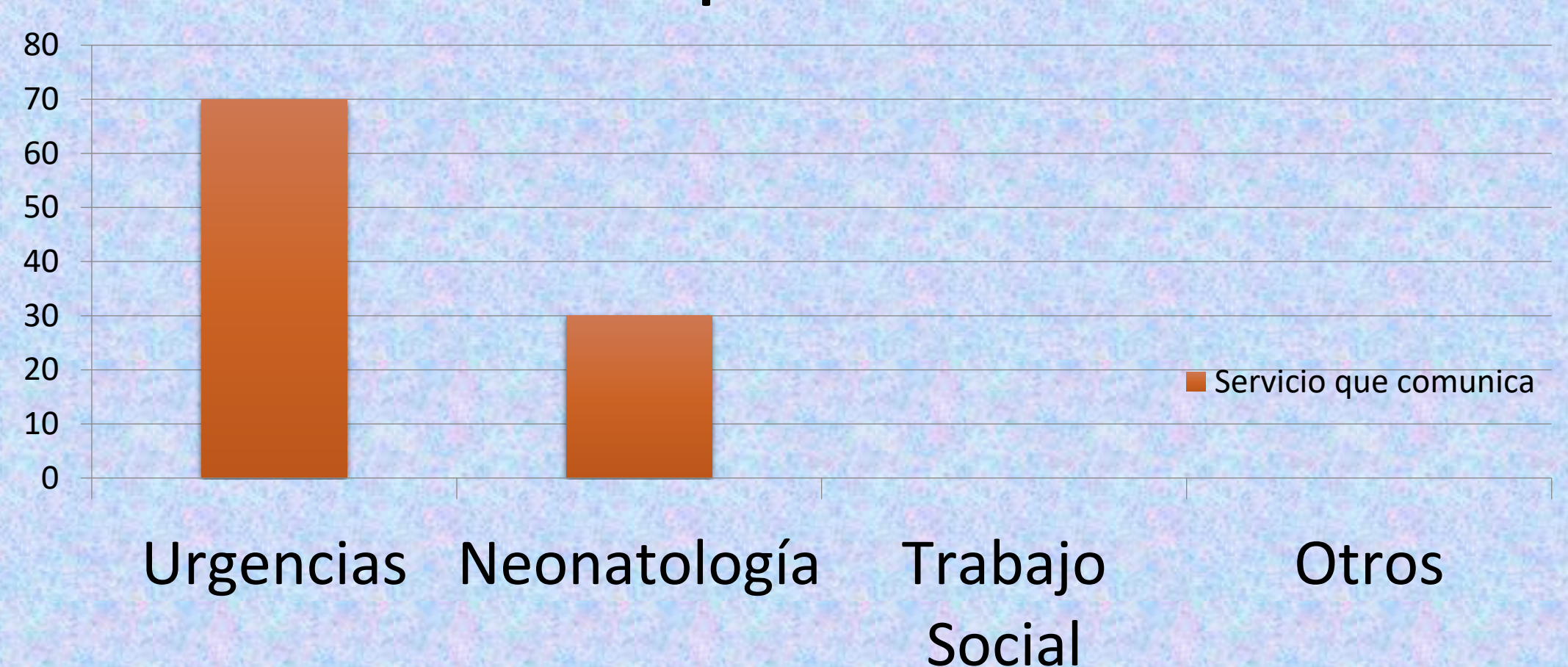
Servicio que comunica

Un 61% de los casos requirió ingreso en el hospital y casi el 10% fueron dados de alta con una familia de acogida o institución. En el 97% de los casos se realizó seguimiento por Servicios Sociales, y en un 67% por los Servicios de Salud.